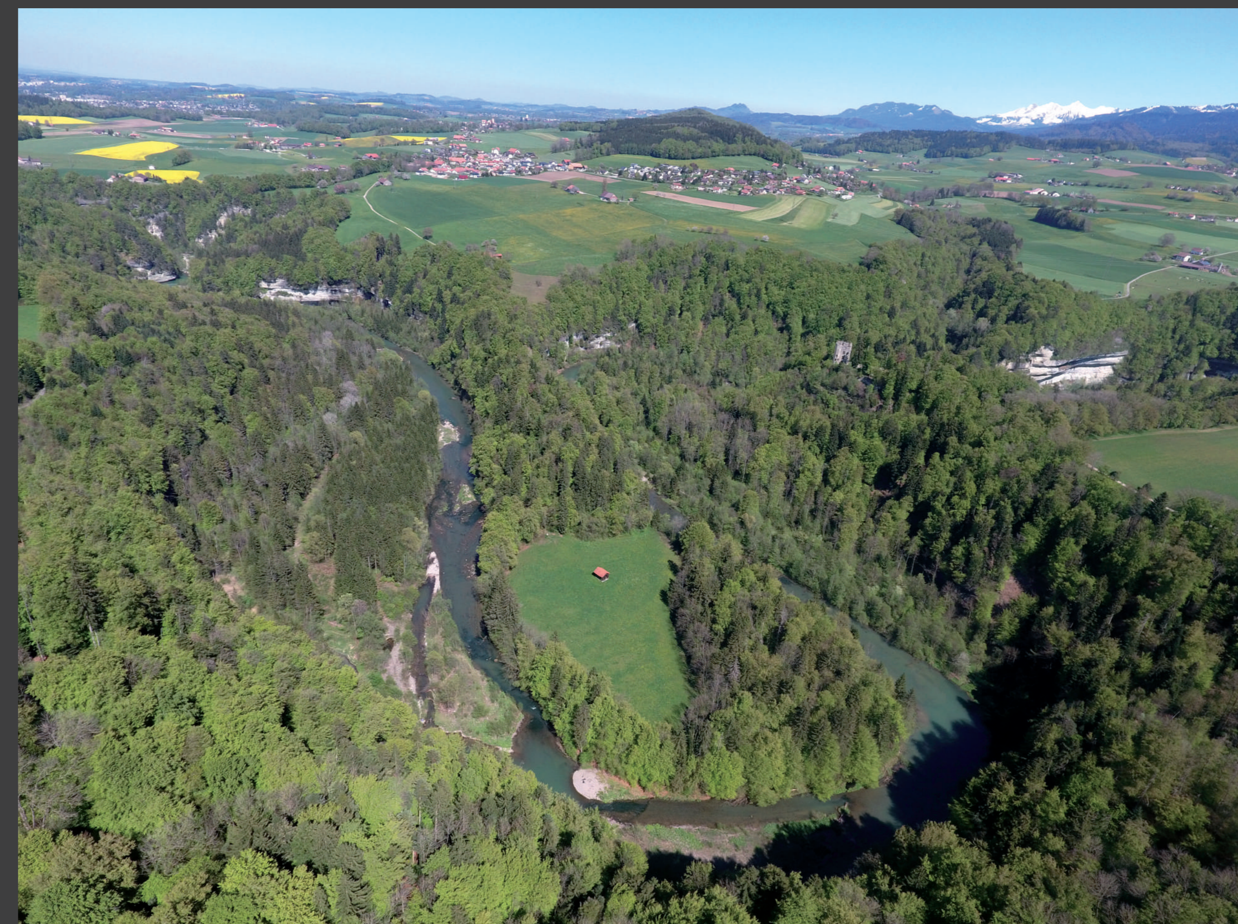
La Sarine à Arconciel, avec l'éperon enserrant le site de hauteur et les abris taillés dans les falaises