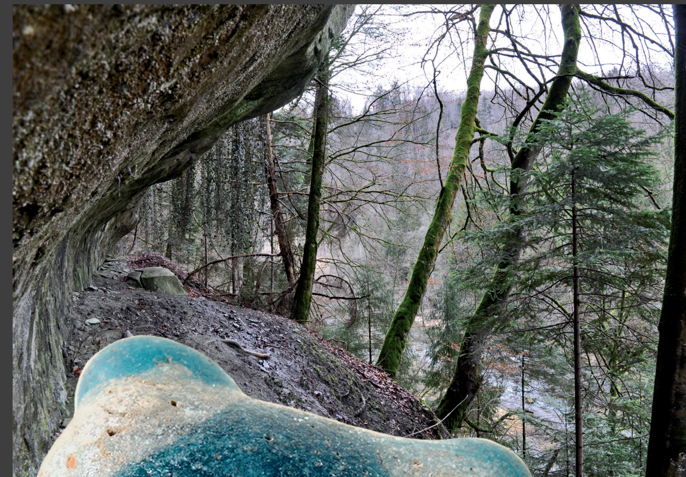
L'abri nord, occupé durant la fin de l'âge du Bronze, vu depuis le nord-est